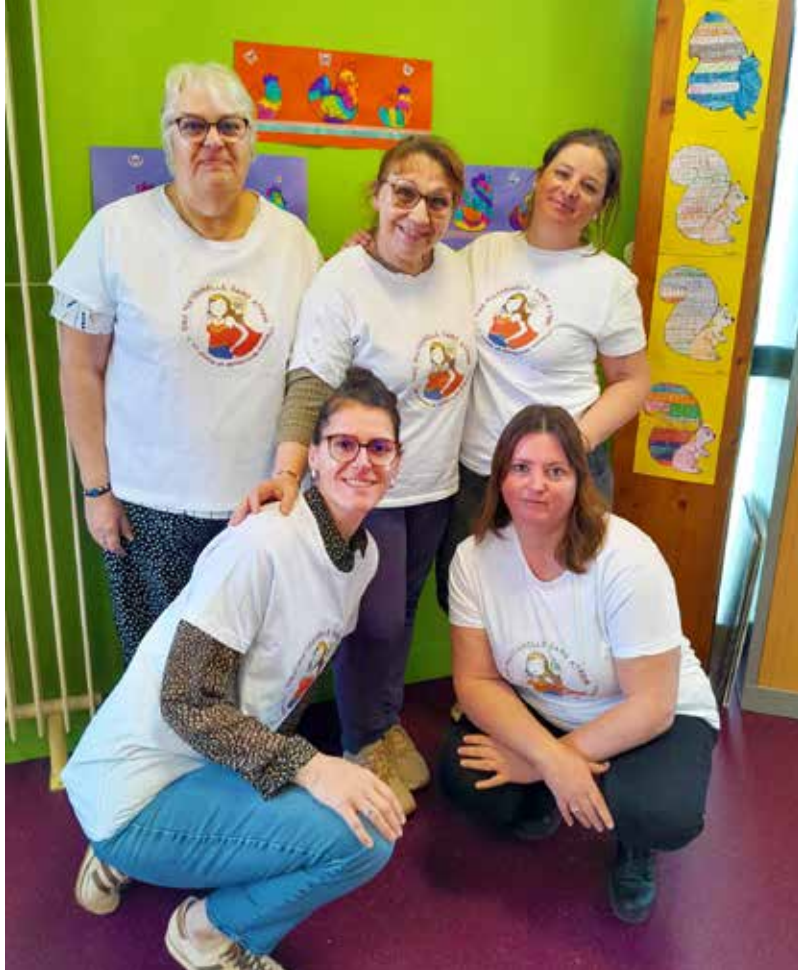
Ci-dessus : école Glatigny