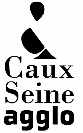
Schéma de Cohérence Territoriale SCoT